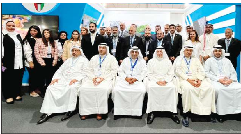
د. بدر الملا والشيخ سالم العبدالله خلال زيارة معرض الكويت

وزارة النفط، أن مشاركة الكويت بالمؤتمر تأتي في إطار حرصها على المساهمة في الجهود الدولية المبذولة لمواجهة الآثار المترتبة لظاهرة التغير المناخي. وأشاد بالجهود الحثيثة التي قدمها القائمون على المعرض والمشاركين بفعاليات المؤتمر واستعراض الجهود والمشاريع النشطة الكبرى التي تنفذها الكويت لخفض الانبعاثات الأمر الذي عكس صورة مشرفة للكويت بالمحافل الدولية. وتستضيف شرم الشيخ المصرية مؤتمر الأمم المتحدة للمناخ «COP27» الذي انطلق يوم الأحد الماضي ويستمر حتى 18 نوفمبر الجاري، بمشاركة قادة وزعماء ووفود من 197 دولة.