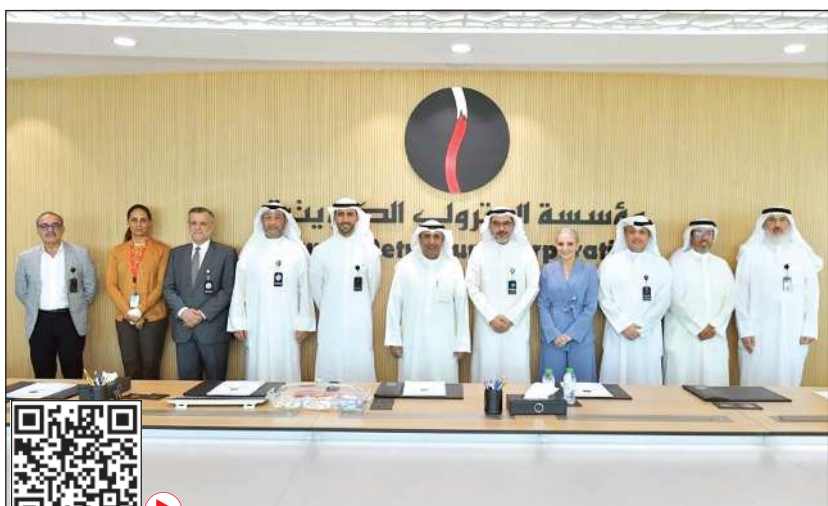
د. بدر الملا والشيخ نواف السعور في لقطة جماعية مع القيادات النفطية الجديدة

لهم التوفيق في مهامهم الجديدة. وأوضحت مؤسسة البترول الكويتية في بيان صحفي، أن الوزير حث القيادات النفطية على ضرورة المضي قدما لتطوير القطاع النفطي بمشاركة الحويزة المختلفة وتنفيذ الإستراتيجيات الخاصة به على أكمل وجه بما فيه مصلحة القطاع النفطي والكويت الحبيبة.